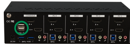
62644I – Rear View