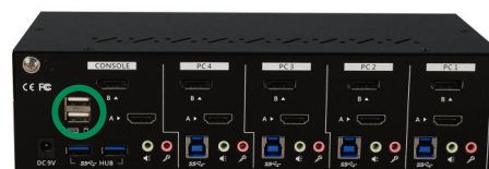
626441 – Rückansicht