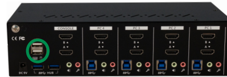
62654I – Rear View